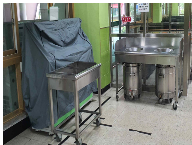
아. 감염병 예방을 위해 식당 버블코크식 학교정수기 운영 중단